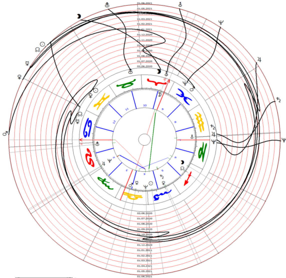
Ephemeride von 02.06.2020 bis 03.06.2021